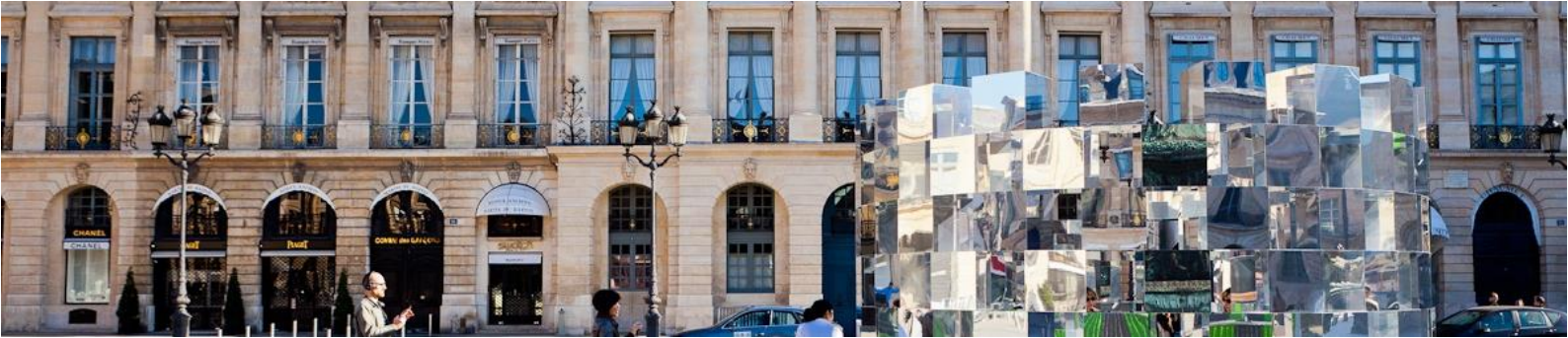
Location: Place Vendôme, Paris.